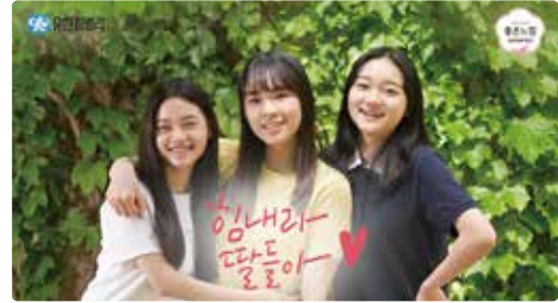
[사진 4-24] 유한킴벌리 '힘내라 딸들아' 생리대 기부 캠페인